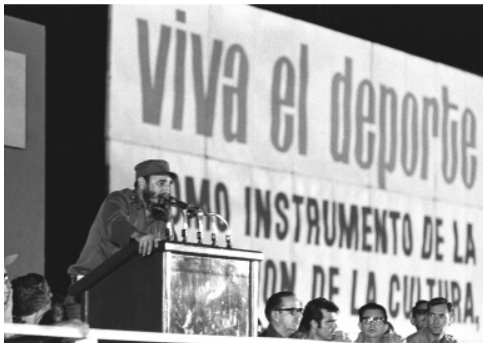
Viva el deporte.