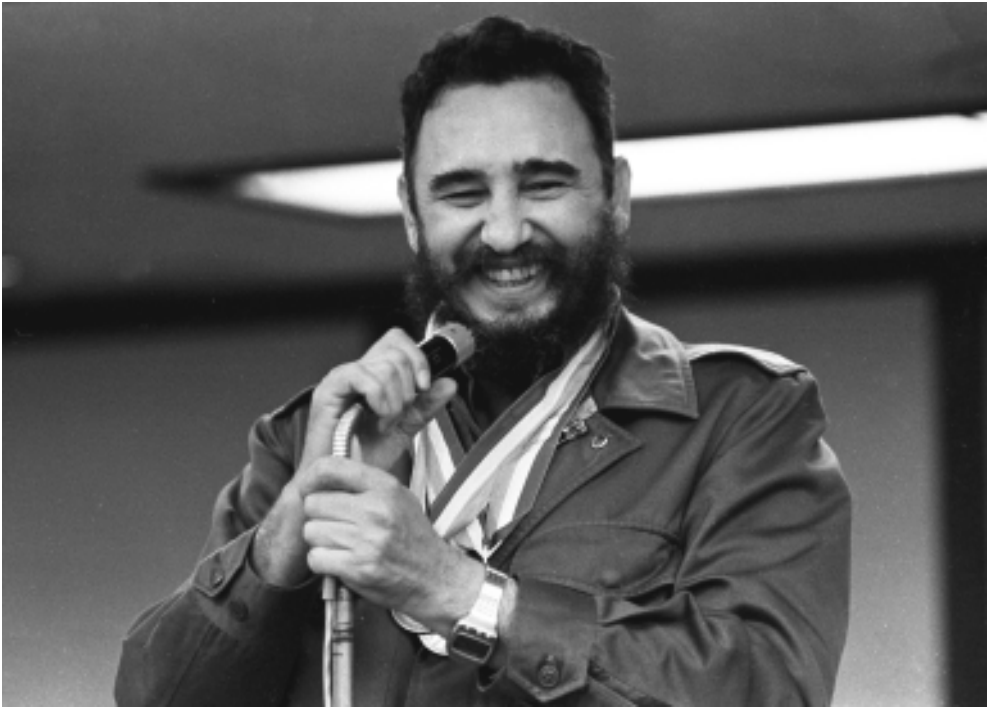
Con las medallas de los vencedores.