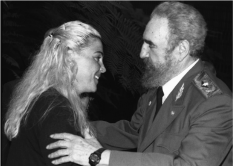
Recibe a la nadadora australiana Sussie Maroney.