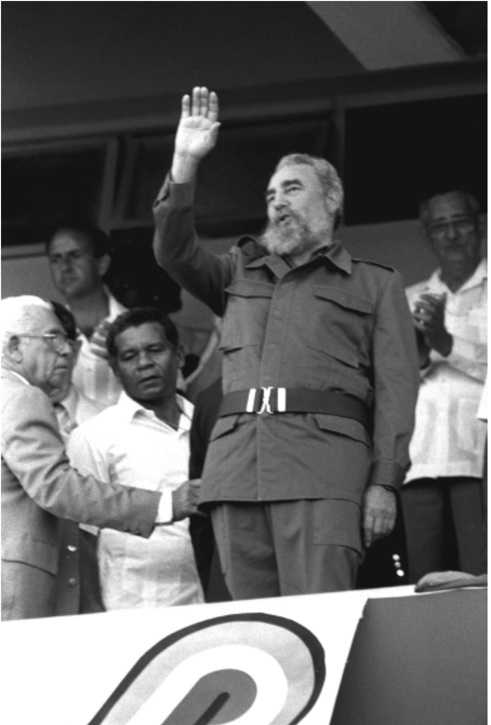
Declara inaugurados los XI Juegos Panamericanos.