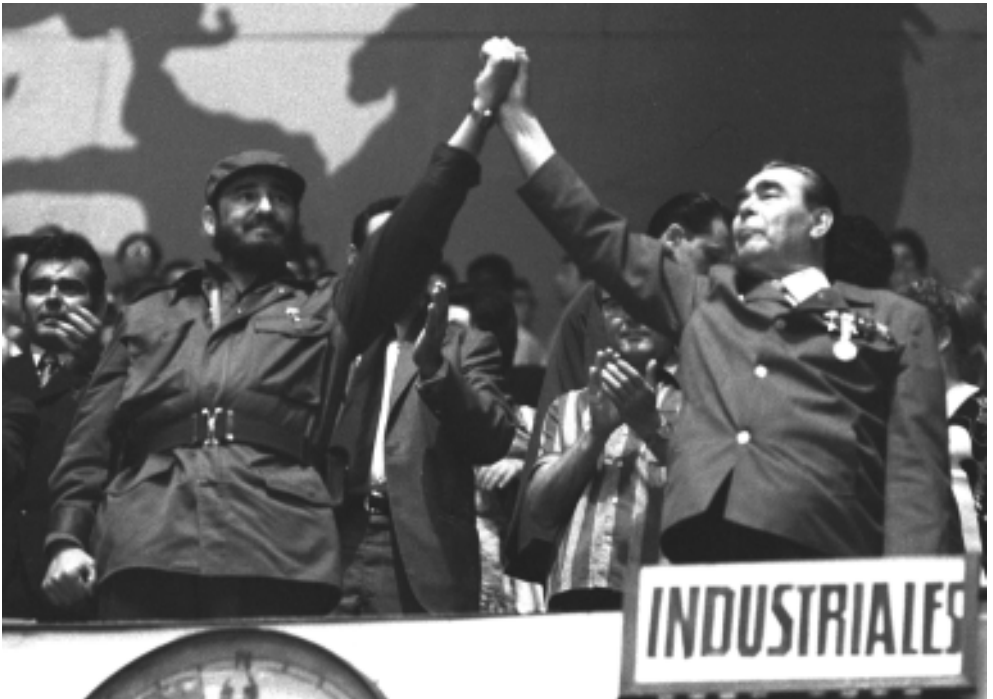
Presencia con Leonid Brezhnev un partido de baloncesto entre Cuba y la URSS.