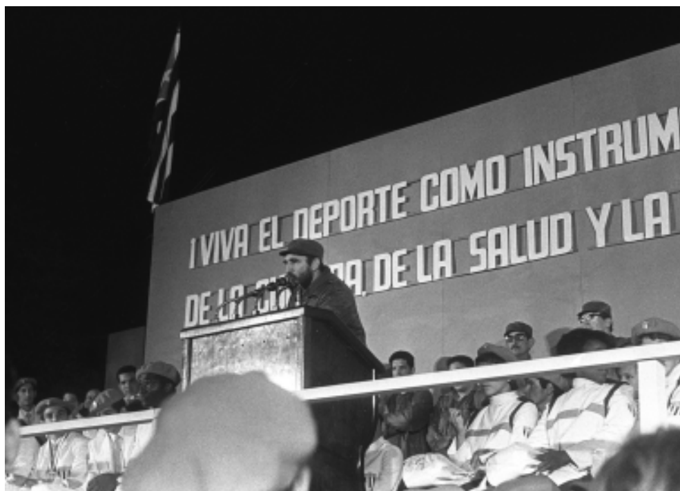
Realiza otro recibimiento triunfal.