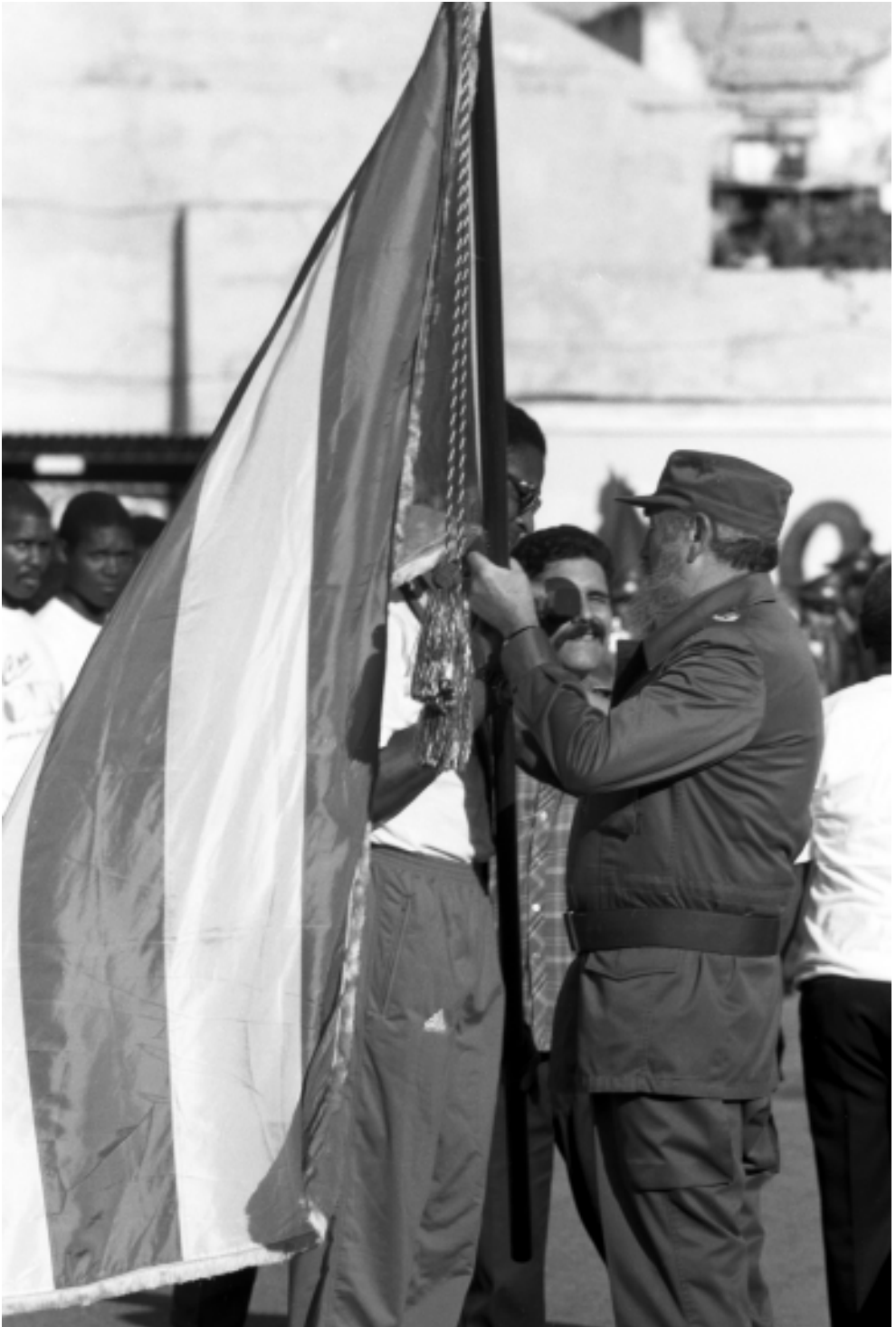
Le entrega la bandera al recordista mundial Javier Sotomayor.