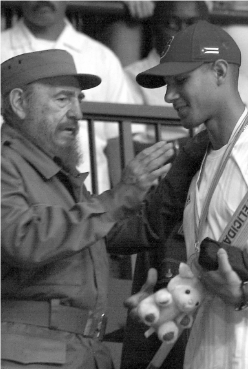
Le entrega a Yulieski Gourriel un recuerdo por su participación en el I Clásico Mundial de Béisbol.