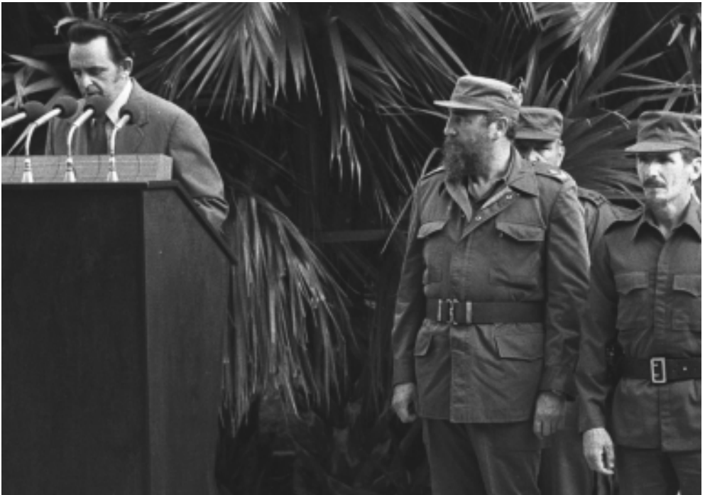
En un acto con motivo de los Juegos Panamericanos.