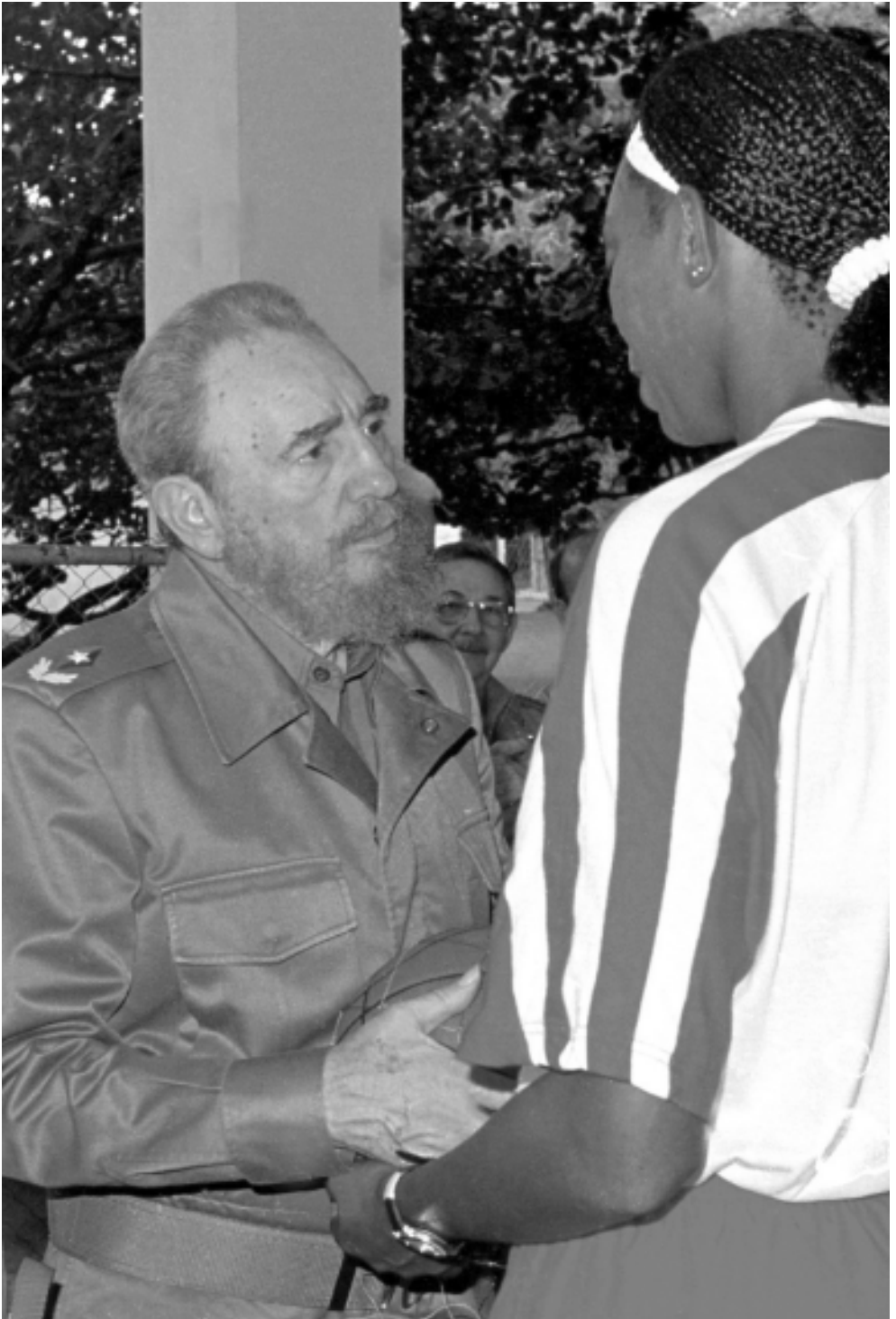
Le gusta escuchar a los atletas.