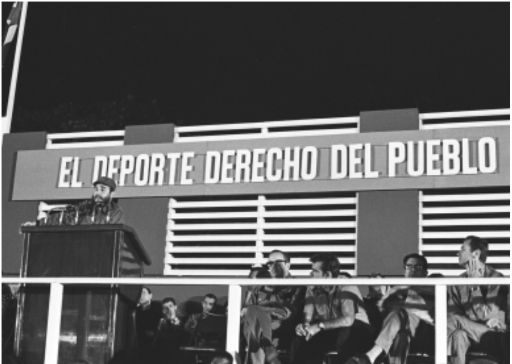
Ratifica que el deporte es un derecho del pueblo.