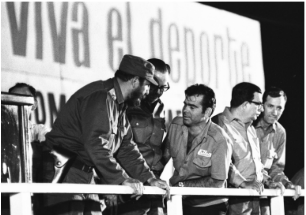
Conversa con el titular del INDER Jorge García Bango y el presidente de Cuba Osvaldo Dorticós.