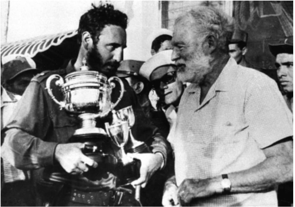
Con el autor de El Viejo y el Mar, Ernest Hemingway