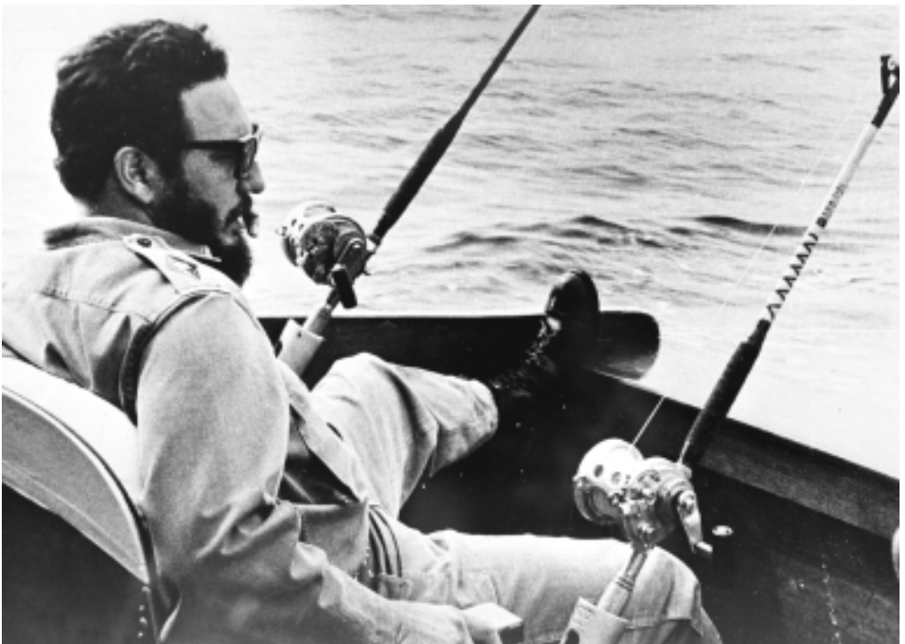
En busca del pez aguja.