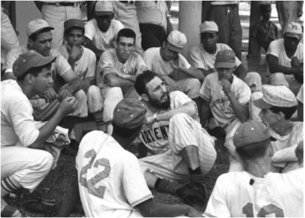
Después del juego todos quieren escucharlo.