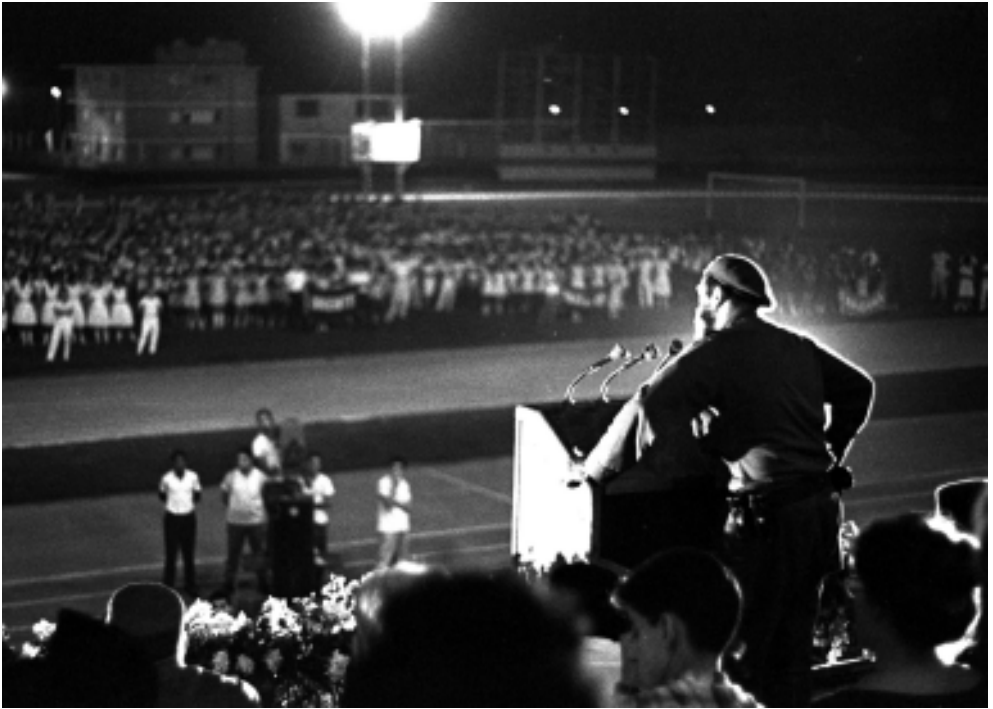
En la inauguración de los I Juegos Deportivos Escolares Nacionales.