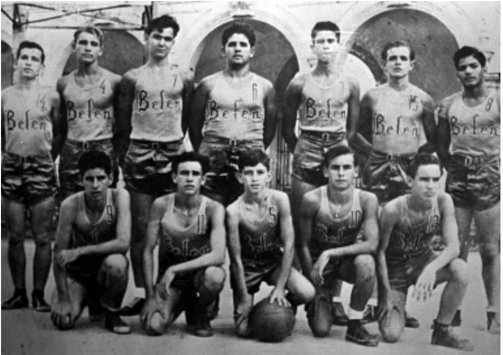
Con el número 6 del equipo de baloncesto del colegio Belén.