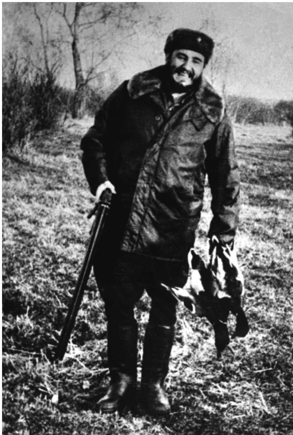
De cacería en la Unión Soviética.